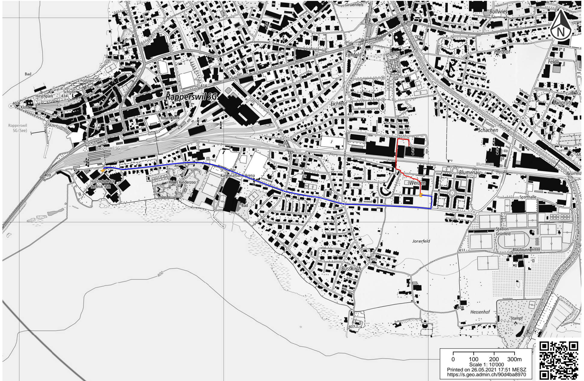
Abbildung 3: Aktuelle Busroute. Die Haltestellen sind in orange angezeigt. In blau ist die Busroute und rot ist der Fussweg.